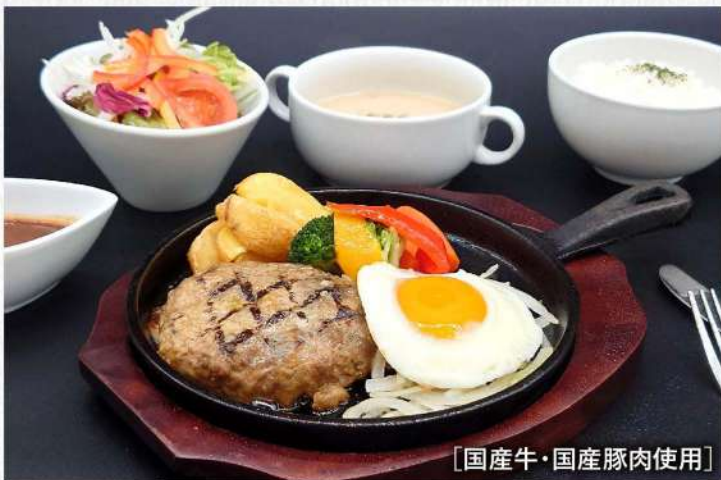
[国産牛・国産豚肉使用]