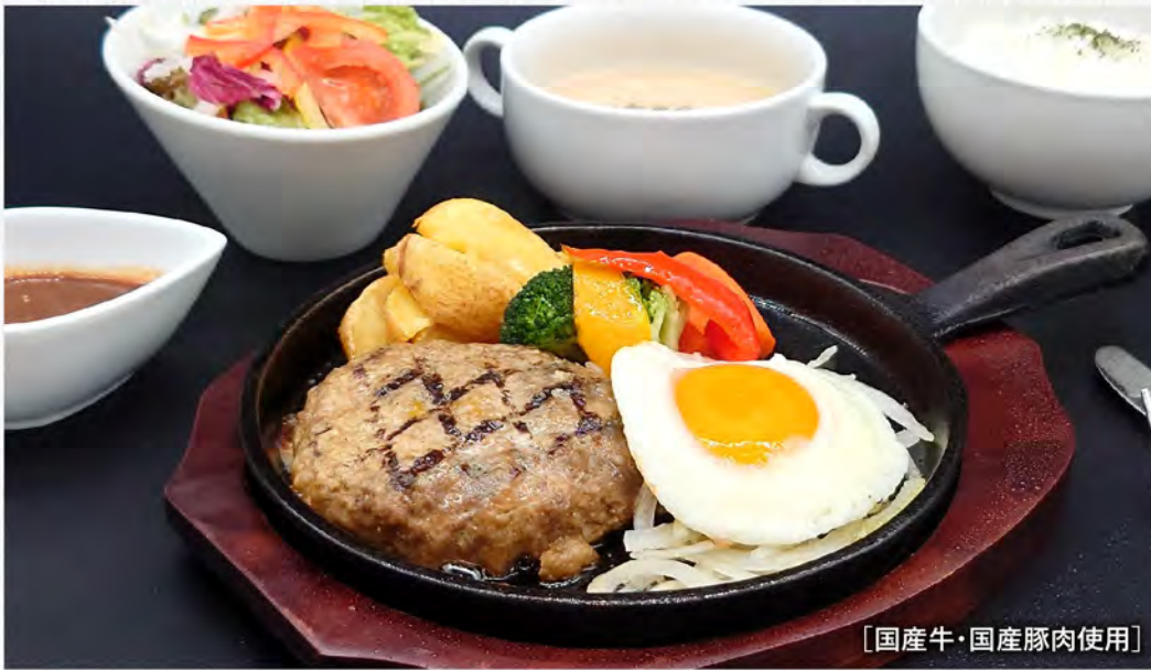
【国産牛・国産豚肉使用】