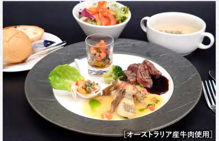
【オーストラリア産牛肉使用】